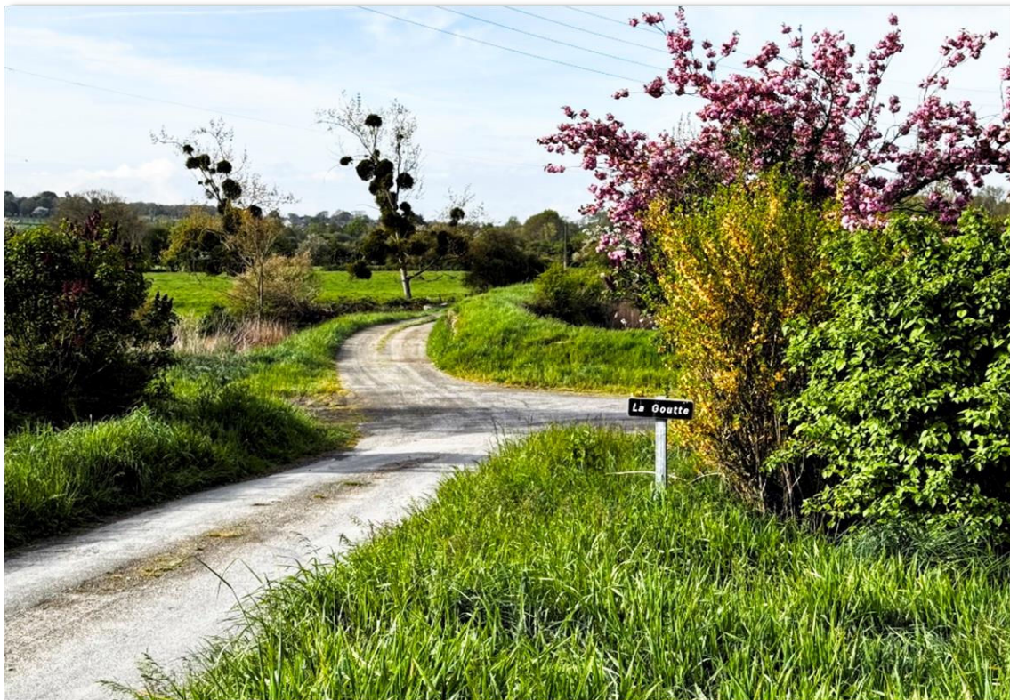
À la mémoire de Régine, qui aimait tant partager...