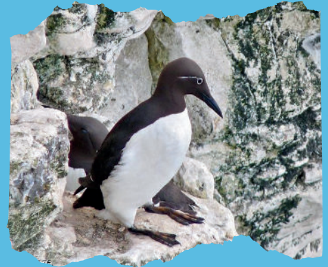
Guillemot de Troïl