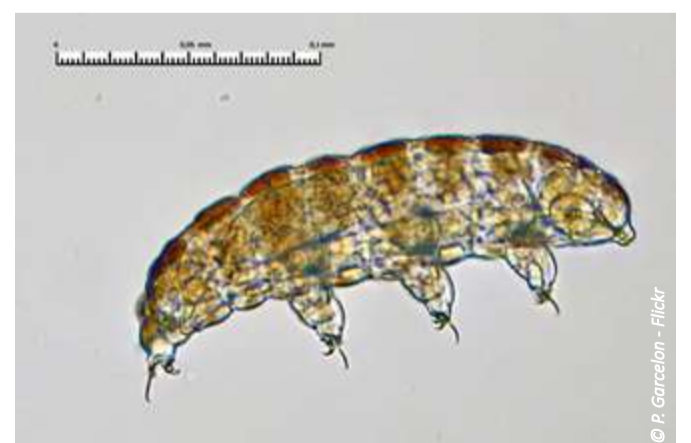
▲ Un tardigrade vu au microscope