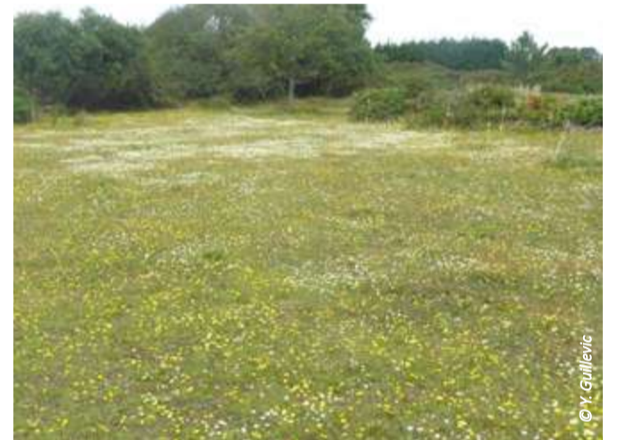
▲ La réserve après le pâturage des vaches pie-noir : une pelouse rase et riche de diversité !