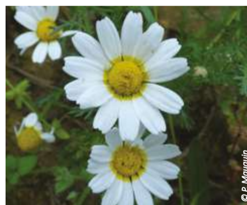
▲ Camomille mixte

Cette partie de la liste serait malheureusement la plus fournie. On y compte le Bleuet ( Centaurea cyanus ), la Nielle des blés ( Agrostemma githago ), la Légousie miroir de Vénus ( Legousia speculum-veneris ), le Coquelicot hispide ( Papaver hybridum ), le Fumeterre à petites fleurs ( Fumaria parviflora ), la Camomille mixte ( Anthemis mixta ), le Gaillet à trois cornes ( Galium tricornutum ), non revu depuis 100 ans, le Peigne de Vénus ( Scandix pecten-veneris ), le Grémil des champs ( Lithospermum arvense ), la Gesse à graines rondes ( Lathyrus sphaericus ), le Fumeterre à fleurs serrées ( Fumaria densiflora ), ou l'Orobanche rameuse ( Orobanche ramosa ).