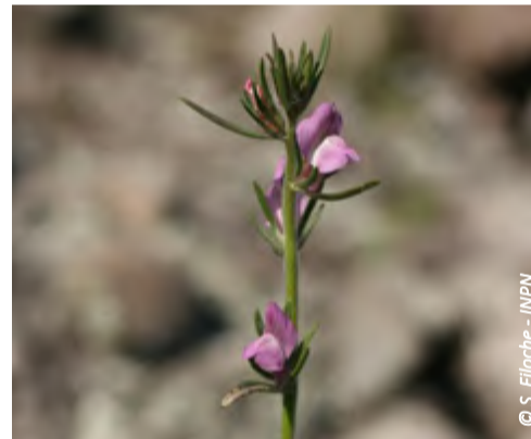
▲ Muflier des champs

Leur répartition bretonne est imprécise car les parcelles agricoles restent peu prospectées par les botanistes. Elles sont aussi assez peu connues du monde agricole et des techniciens qui se concentrent sur la maîtrise des espèces les plus problématiques. On peut citer le Petit alpiste ( Phalaris minor ), les anthémis ( Anthemis arvensis et cotula ), le Vulpin des champs ( Alopecurus myosuroides ), la Gastridie ventrue ( Gastridium ventricosum ), les valérianelles ( Valerianella rimosa , et dentata ), ou le Fumeterre de Bastard ( Fumaria bastardii ).