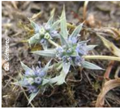
▲ Le Panicaut vivipare (famille des Apiacées) mesure 15 cm à plat maximum.

Connaissez-vous le Panicaut vivipare ( Eryngium viviparum ) ? Cette plante figure parmi les plus rares et les plus menacées d'Europe. En France, elle est strictement morbihannaise, elle ne vit qu'à Belz, sur la réserve des Quatre-Chemins, gérée depuis 1990 par Bretagne Vivante.