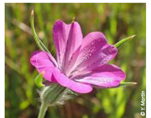
▲ Nielle des blés