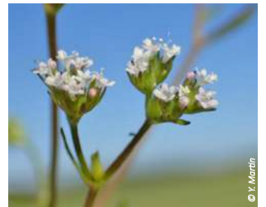
▲ Valérianelle dentée