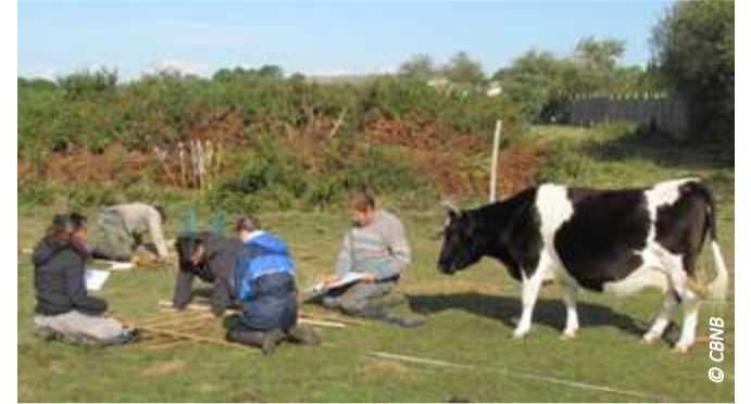
▲ Suivi botanique du panicaut sous l'œil d'une pie-noir