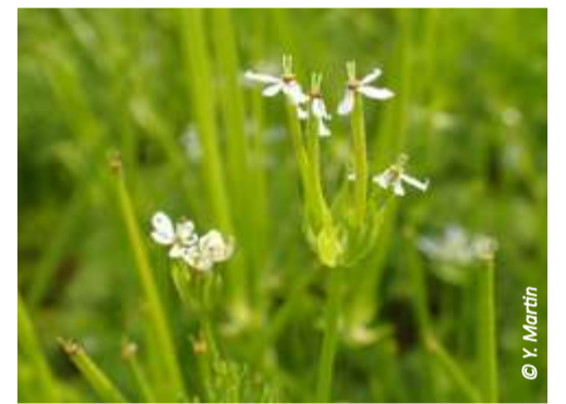
▲ Peigne de Vénus