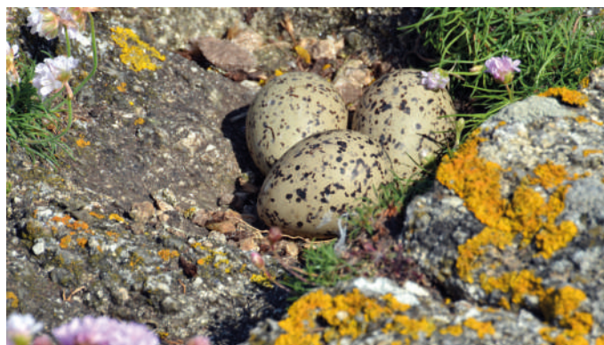
Nid d'huitrier pie