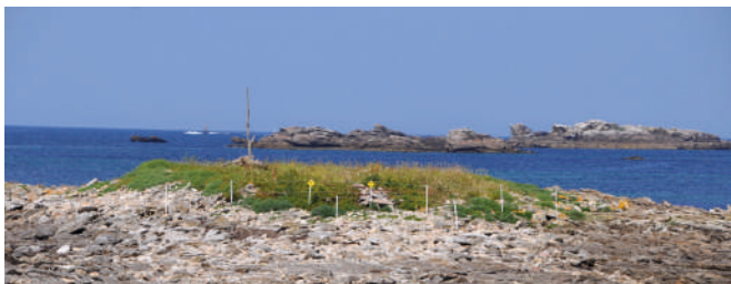
Îlot de la Croix

La saison de nidification est une période sensible pour les oiseaux, coïncidant avec celle de la fréquentation touristique sur l'archipel.