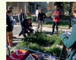
Formation sur la nature en ville dans le quartier Cleunay à Rennes