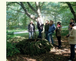
Formation « Animer sur l'arbre » à Rennes

Nous accompagnons les animateurs à s'appuyer sur la nature et leur environnement immédiat pour construire des projets et activités pédagogiques avec leurs publics.