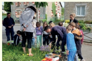
Photo ci-contre : Plantation en pied de mur avec les élèves de l'école publique les agents communaux de Saint-Aubin du cornier

Bretagne Vivante a développé une offre régionale de formations professionnelles dans les domaines de l'éducation à l'environnement, la gestion des milieux semi-naturels et naturels et de l'expertise naturaliste.